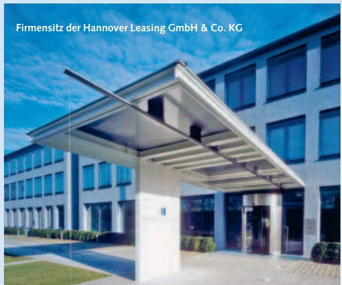
Firmensitz der Hannover Leasing GmbH & Co. KG

DR. VOLCKENS: Es ist schon erstaunlich, was aktuell alles als „prime“ auf Anbieterseite gehandelt wird. Schließlich macht allein ein langfristiger Mietvertrag mit einem bonitätsstarken Mieter ein Gebäude nicht zur „Class A“-Anlage. Aber grundsätzlich ist es richtig, dass die Ankaufsrenditen für qualitativ gute Immobilien in den vergangenen Monaten erheblich gesunken sind. Dies liegt sicher zum einen an der hohen Nachfrage, ist aber allerdings auch